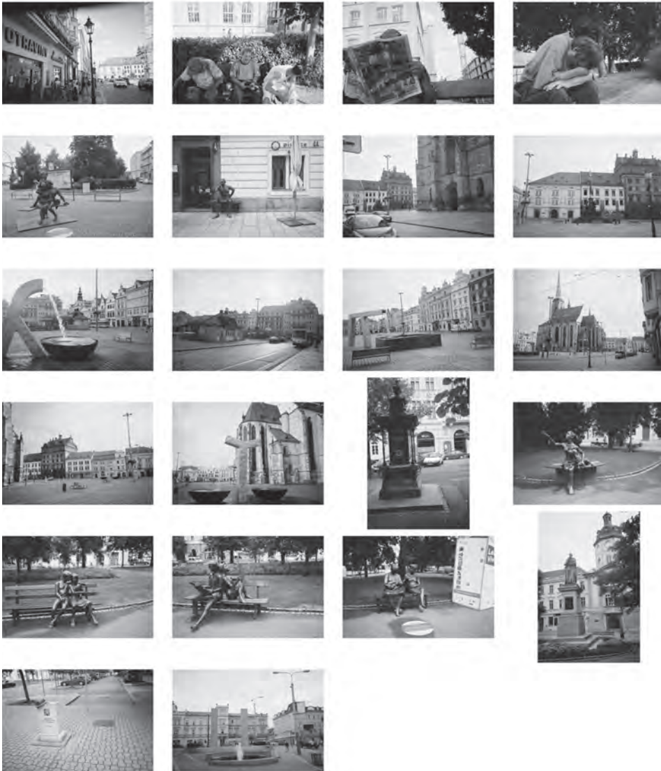
Obrázek 1. Sada Vladislava