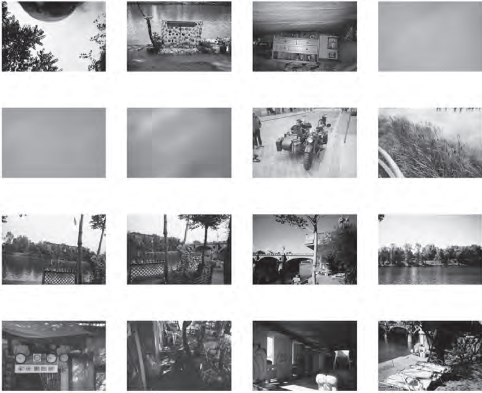
Obrázek 4. Sada Václava