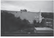
Obrázek 2. Sada Luky