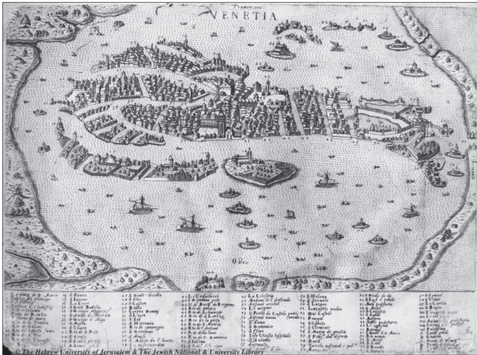
Obrázek 2. Zobrazení Benátek z dílny Simona Pinargentiho z roku 1573